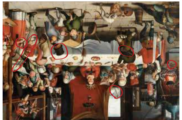
• Solución Actividad 2 · Soluzioa Jarduera 1